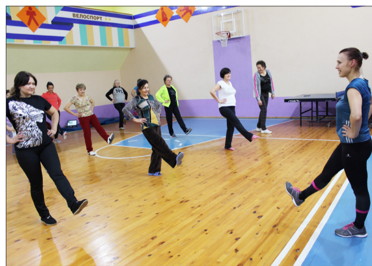
Спортивные занятия для участников семинара

Семинар-обучение прошел на высоком организационном уровне. Выражаем благодарность организаторам и участникам мероприятия.