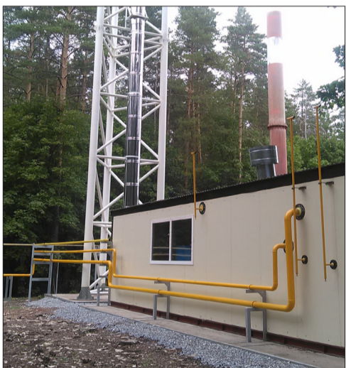
Котельная о/л «Солнечный» (общий вид)

В Альметьевском районе, в 4 километрах северо-западнее д. Поташная поляна, в Елховском теплоэнергетическом цехе, реконструирована котельная оздоровительного лагеря «Солнечный». Данная котельная была введена в эксплуатацию в 2002 году, общей мощностью 2,15 Гкал/час, оборудованная двумя котлами КВ-Г-1,0-115 и одним котлом КВ-Г-0,5-115, круглогодичная, вырабатывает тепловую энергию для нужд отопления и ГВС о/л «Дружба» НГДУ «Джалильнефть» и о/л «Солнечный» НГДУ «Елховнефть». В связи с большой посещаемостью детских оздоровительных лагерей ПАО «Татнефть», принято решение о строительстве по одному спальному корпусу в о/л «Солнечный» и «Дружба», с вместительностью по 66 человек в каждом