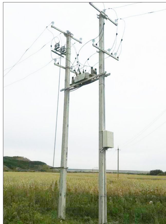
Данная система реализована на реклоузере № 1630 ф.14-01 НГДУ «Прикамнефть»

Для передачи информации далее от питающей подстанции до диспетчерского пункта могут применяться другие, имеющиеся на подстанции каналы связи: радиоканал, GPRS/GSM канал, оптоволокно, Ethernet или выделенные телефонные линии. Реализация телесигнализации