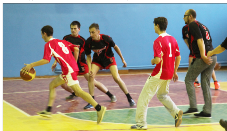
Участники соревнований по баскетболу (игра между командами Елховской и Бавлинской ПБ)

В конце уже крики утихли, азарт пропал, в зале ви-