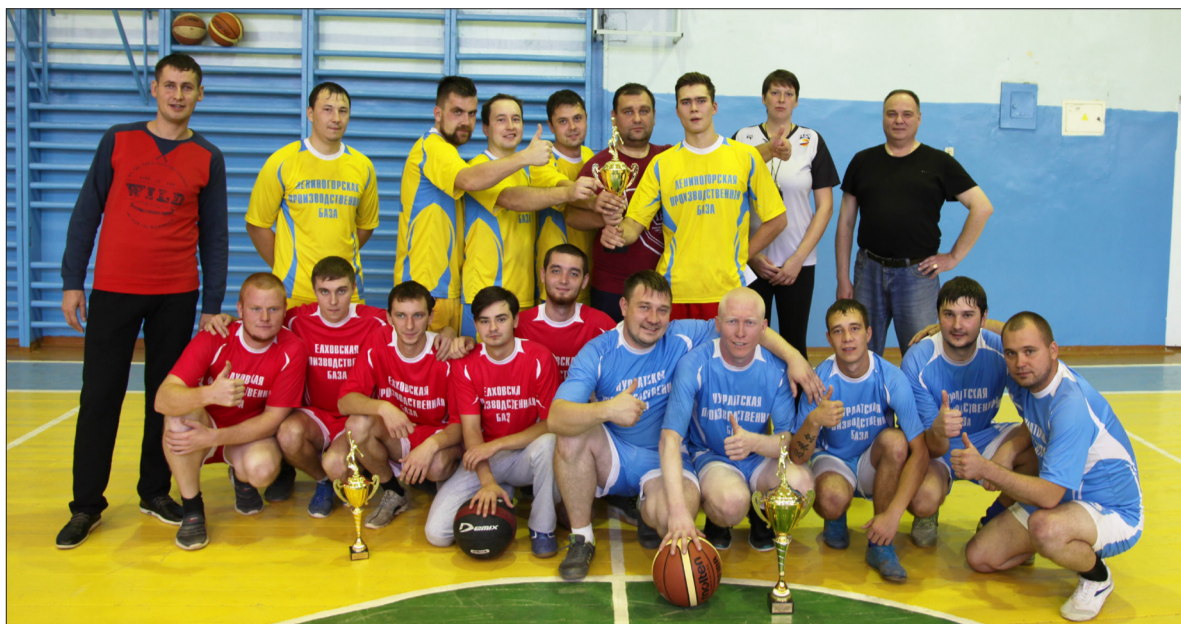
Победители и призеры соревнований по баскетболу. I место - Нурлатская ПБ; II место - Лениногорская ПБ; III место - Елховская ПБ.

Групповые игры прошли в ожесточенной борьбе, никто не хотел уступать, но все же в каждой группе определились по две команды, которые прошли в следующий, финальный этап. Как групповые, так и финальные игры прошли в такой насыщенной атмосфере и азарте, что спортивный зал школы нельзя было отличить от огромного стадиона. В результате,