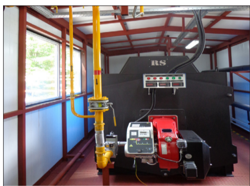
Котельная о/л «Солнечный» (вид изнутри)

В Альметьевском районе, в 4 километрах северо-западнее д. Поташная поляна, в Елховском теплоэнергетическом цехе, реконструирована котельная оздоровительного лагеря «Солнечный». Данная котельная была введена в эксплуатацию в 2002 году, общей мощностью 2,15 Гкал/час, оборудованная двумя котлами КВ-Г-1,0-115 и одним котлом КВ-Г-0,5-115, круглогодичная, вырабатывает тепловую энергию для нужд отопления и ГВС о/л «Дружба» НГДУ «Джалильнефть» и о/л «Солнечный» НГДУ «Елховнефть». В связи с большой посещаемостью детских оздоровительных лагерей ПАО «Татнефть», принято решение о строительстве по одному спальному корпусу в о/л «Солнечный» и «Дружба», с вместительностью по 66 человек в каждом